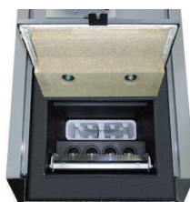
Spalovací komora a výměník